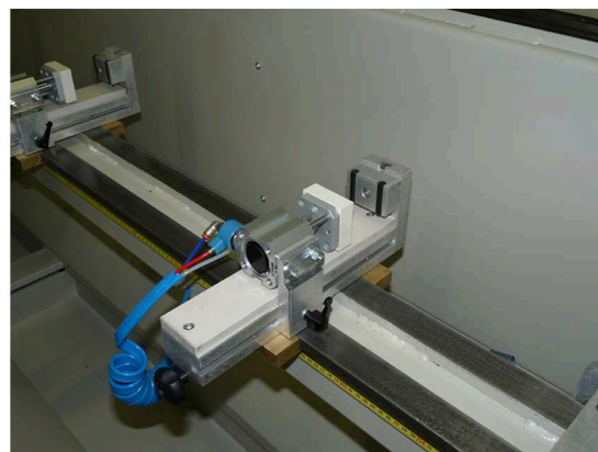
4 étaux pneumatiques sur rails